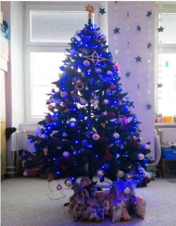
Škôlkarský vianočný stromček

Po tej dlhej ceste konečne už zlož, pod zelený stromček ten svoj veľký kôš. Vieme, že z tých darov aj nám niečo dáš, vitaj, vitaj medzi nami milý Mikuláš.“