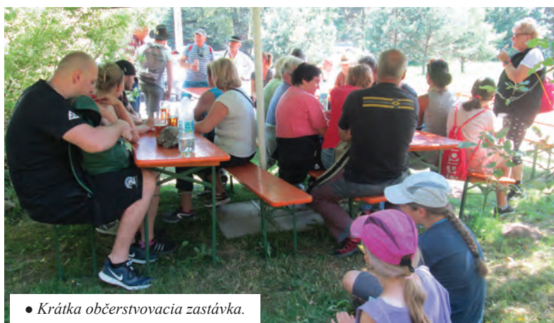
• Krátka občerstvovacia zastávka.