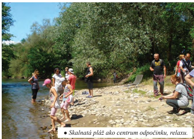
• Skalnatá pláž ako centrum odpočinku, relaxu.