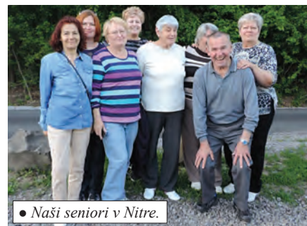
• Naši seniori v Nitre.

pre všetkých. Výbor klubu Lúčina pozval 22. mája svojich členov na jarnú opekačku. O pohostenie sa postaral výbor v podobe slaninky, špekáčikov, zeleniny a aby nezaškodilo, aj niečo na zapitie. Opekali sme na tzv. satelite, aby sme mohli opekané spolu skonsumovať. Účasť bola i z dôvodu nemoci menšia, ale napriek tomu veselá. Aj keď nebol s nami náš harmonikár, zaspievali sme si, komunikácia neviazla, dokonca sme naplánovali aj niečo nové do klubu. Rozchádzali sme sa vo večerných hodinách, po uprataní priestoru a ohňa. Na očiste obecného cintorína sme mali brigádu 24. mája. Hoci bola niekoľkokrát vyhlásená obecným rozhlasom,