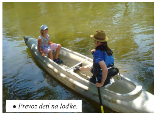
• Prevoz detí na loďke.