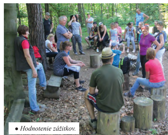
• Hodnotenie zážitkov.