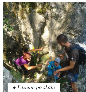
• Lezenie po skale.