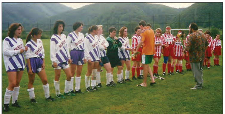
• Zo zápasu s prvoligových ženských klubov Rimavská Sobota - Dolný Kubín 0:3, v prestávke turnaja v Lučatíne.

V majstrovských zápasoch jesennej časti II. triedy hrali Lučatínčania so striedavými úspechmi a v tabuľke skončili na šiestom mieste. V príprave na jarnú časť odohrali deväť prípravných zápasov a absolvovali aj sústredenie v Tajove. Jarnú časť súťaže však nezvládli. Súperi ich prevýšili a v tabuľke Lučatín skončili až na jedenástom mieste, len jeden bod pred poslednou Michalovou.