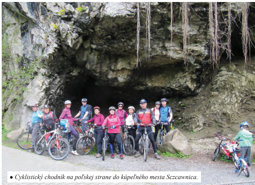
• Cyklistický chodník na poľskej strane do kúpeľného mesta Szczawnica.

Späť sme sa vracali s pohodlnou cestou - náučným chodníkom s červeným značkováním, Prielomom Dunajca dlhom 9 km, pričom sme mali možnosť sledovať plte šikovne manévrované pltníkmi v goralských klobúkoch. Cesta prielomom sa mnohokrát zatočila kopírujúc tvar meandrov zakles-