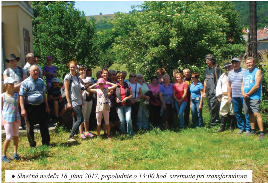
• Slnečná nedeľa 18. júna 2017, popoludnie o 13:00 hod. stretnutie pri transformátore.